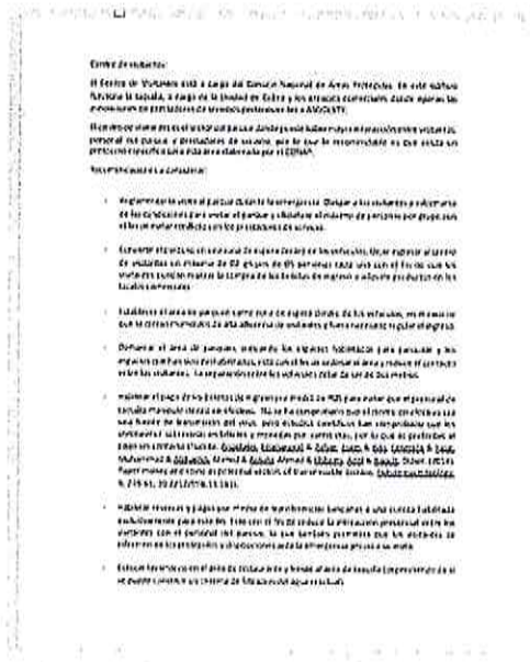
Fig.3: Recomendaciones para la atención de visitantes en el Centro de Visitantes durante emergencia por el COVID-19.

Se elaboraron recomendaciones para la atención de visitantes y operación del Centro de Visitantes ante una eventual reapertura del parque al público durante la emergencia sanitaria del COVID-19.